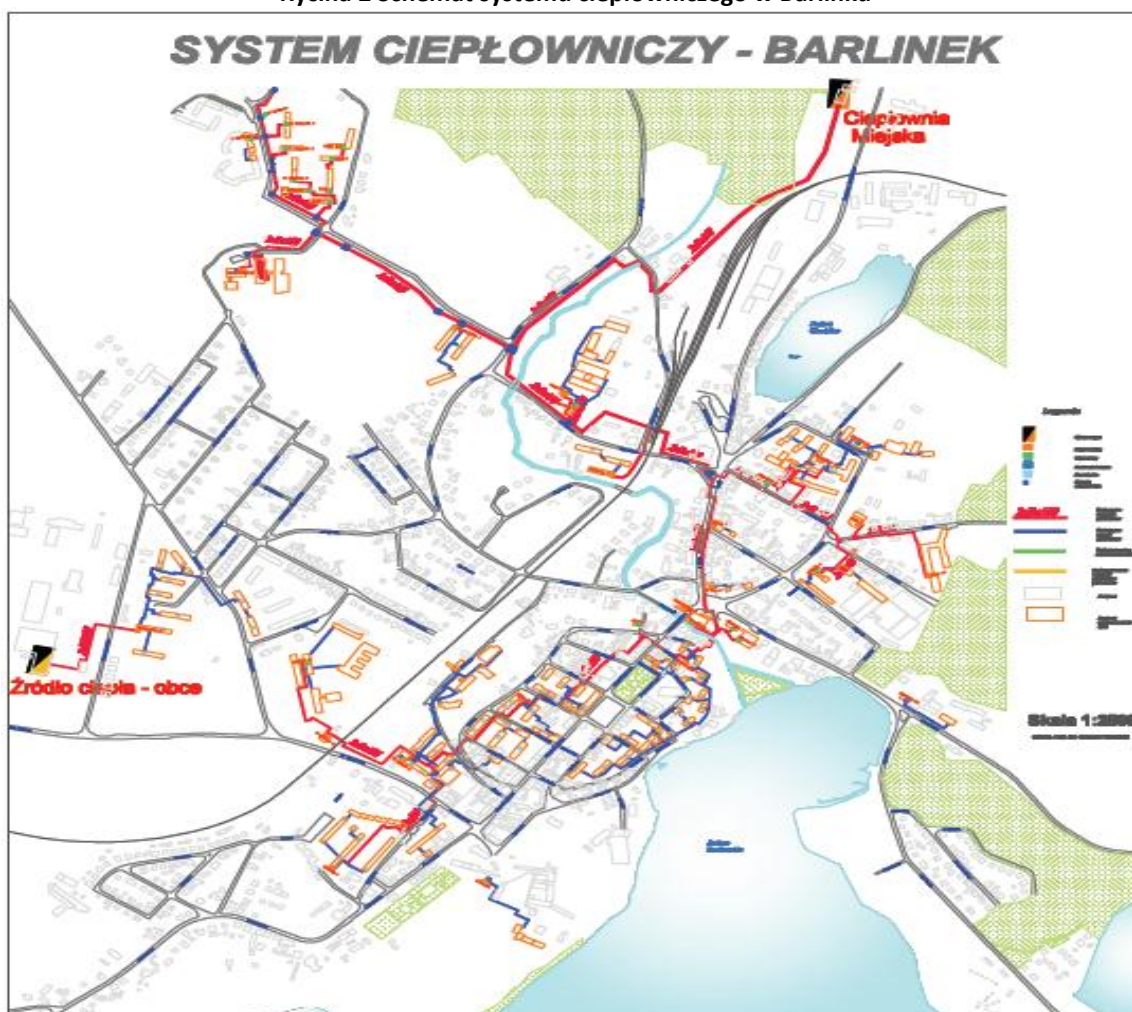
Rycina 2 Schemat systemu ciepłowniczego w Barlinku

Na terenie miasta i gminy funkcjonuje Przedsiębiorstwo Energetyki Ciepłej spółka z o.o. System ciepłowniczy miasta Barlinku jest eksploatowany od roku 1992.